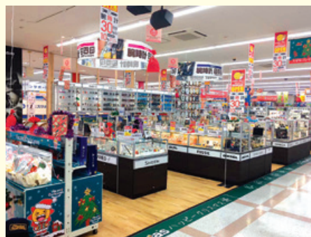
▲国内外のブランドを取り揃え(梶ヶ谷店)

消費税増税後の売上反動減を見据え、家電の幅広い品揃えや専門性の向上に加えて、トイズ、自転車、腕時計や酒類など非家電の取扱いも進めてまいりました。2019年10月12日に「コジマ×ビックカメラ 梶ヶ谷店」で腕時計の販売を開始し、11月2日に「コジマ×ビックカメラ 卸団地店」で酒類の販売を開始するなど、来店頻度の向上と他社との差別化につなげております。