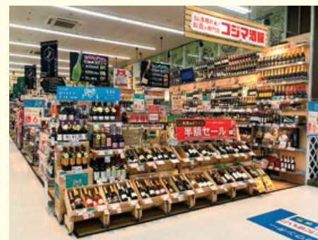
▲東北地区初となる酒類販売の開始(卸団地店)