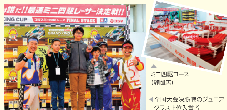
▲ミニ四駆コース(静岡店) ▲全国大会決勝戦のジュニアクラス上位入賞者

※なお、新型コロナウイルス感染防止の観点から、現在、当イベントは中止しております。