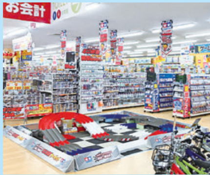
客層を考慮した広めの玩具売り場

今後においては、11月25日に、愛知県に開業するショッピングモールのプライムツリー赤池に「コジマ×ビックカメラプライムツリー赤池店」を出店する予定で、本年度も新店による事業拡大を実現してまいります。