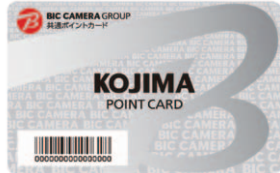
コジマポイントカード