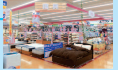
コジマ×ビックカメラ宇都宮本店に設置した寝具売り場