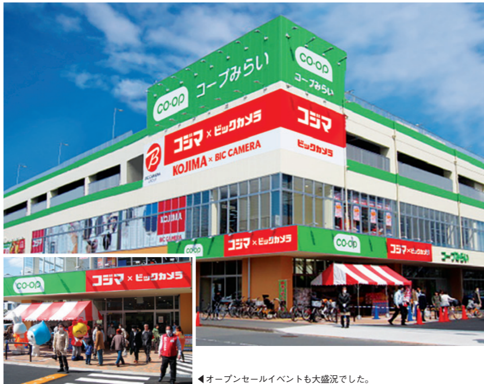
←オープンセールイベントも大盛況でした。

今後もコジマは、くらし応援企業として、地域の皆様から最も身近に親しまれ必要とされる企業であることにこだわり、挑戦を続けてまいります。