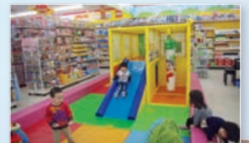
一部店舗にキッズ広場を設置