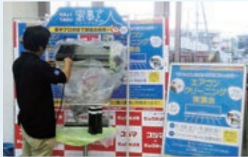
一部店舗にて店頭実演も行っております

「家事玄人<カジクラウド>」は、商品として「家事代行サービス」を購入できます。宅配便で届くチケットを利用して電話予約をするだけで、プロが面倒な家事を代行してくれます。母の日や敬老の日、奥様へのプレゼントに最適です。