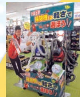
店内には、販売員の等身大POPを設置!

販売員の等身大POPを設置! コジマ×ビックカメラ 梶ヶ谷店 リニューアルオープン