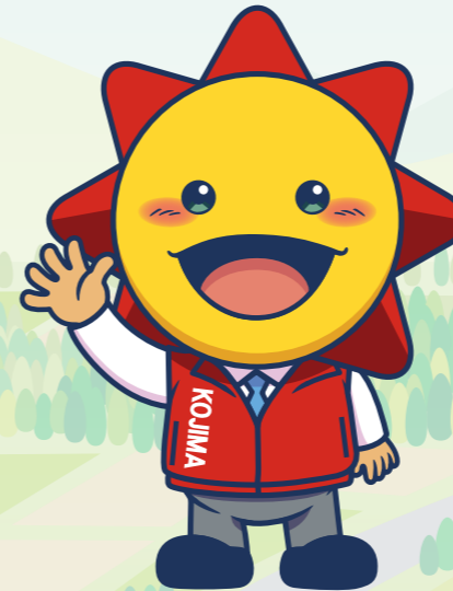
コジマのキャラクター「コジ坊」

「暮らし応援」企業 として進化し続ける コジマを「コジ坊」が 紹介していきます。